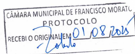
ILDO DA SILVA GUSMÃO Prefeito Municipal